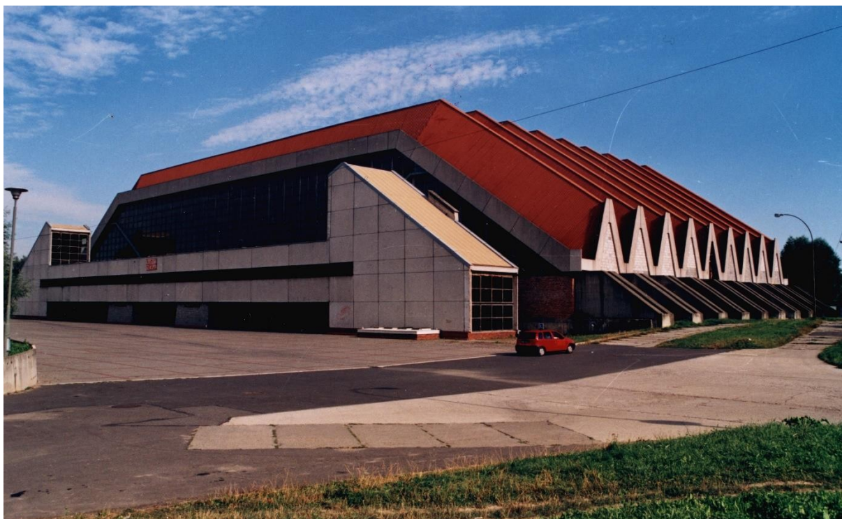
Rys. 6. Hala widowiskowo – sportowa w Rzeszowie przed modernizacją

• W Hali widowiskowo – sportowej w Rzeszowie zastosowano fałdowy kształt konstrukcji przekrycia (rys. 6, rys. 7). Tutaj dominantą pierwszej wersji rozwiązania funkcjonalnego było umieszczenie pod jednym dachem trzech różnych funkcji sportowych: pływalnia, arena główna i boisko treningowe. Doprowadziło to do dwuprzegubowej fałdowej ramy stalowej, opartej na żelbetowych przyporach oraz do symetrycznego układu obustronnych trybun.