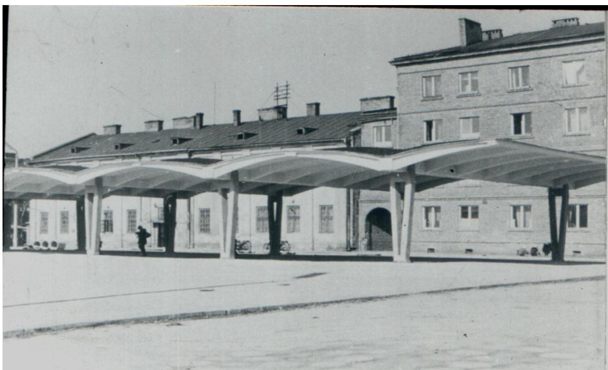
Rys. 2. Wiata obok hali targowej w Rzeszowie

• Budując MOSiR w Rzeszowie (rys. 3) wzniesiono halę pływalni o przekryciu złożonym z trójkątnych dźwigarów o rozpiętości 24 m, zestawianych z trzech rodzajów płyt żebrowych o szerokości 1.5 m. Istota nowoczesności polegała na tym, że dźwigary składano i sprężano w całości na ziemi pomiędzy słupami, podnoszono wciągarkami do góry, obracano i osadzano (rys. 4) na głowicach słupów.