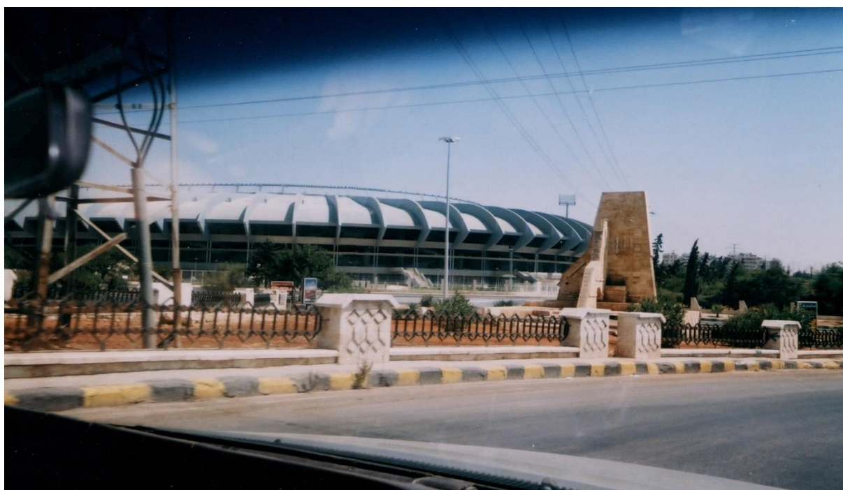
Rys. 8. Duży stadion ASC w Aleppo – Syria; widok od zewnątrz

• Inne i o znacznie większej skali rozwiązanie zastosowano w obiektach sprężonych Aleppo Sport City w Syrii (ASC). Medina Rijadije Halabije to największy na terenie Małej Azji zespół obiektów sportowych – usytuowanych w półtoramilionowym Aleppo. Składa się z dużego stadionu dla 75000 widzów, hali sportowej dla 10000 widzów, krytej pływalni, kąpieliska otwartego i małego stadionu dla 15000 widzów. Prawie kilometrowej długości trzypiętrowa trybuna stadionu dla 75000 widzów wspiera się na monolitycznych ramach żelbetonowych, rozstawionych co około dziesięć metrów (rys. 8). Trybuny w całości są osłonięte dachem o trzydziestometrowym wsporniku (rys. 9). Każdą z belek wspornikowych sprężono 18 kablami CCL o nośności 1300 kN, złożonymi z 7 lin \Phi 13 mm. Duży stadion oddano do użytkowania jesienią 2004 roku, a pokazany na rysunkach 8 i 9 stan zaawansowania na nim robót budowlanych pochodzi z lipca 2004 r.