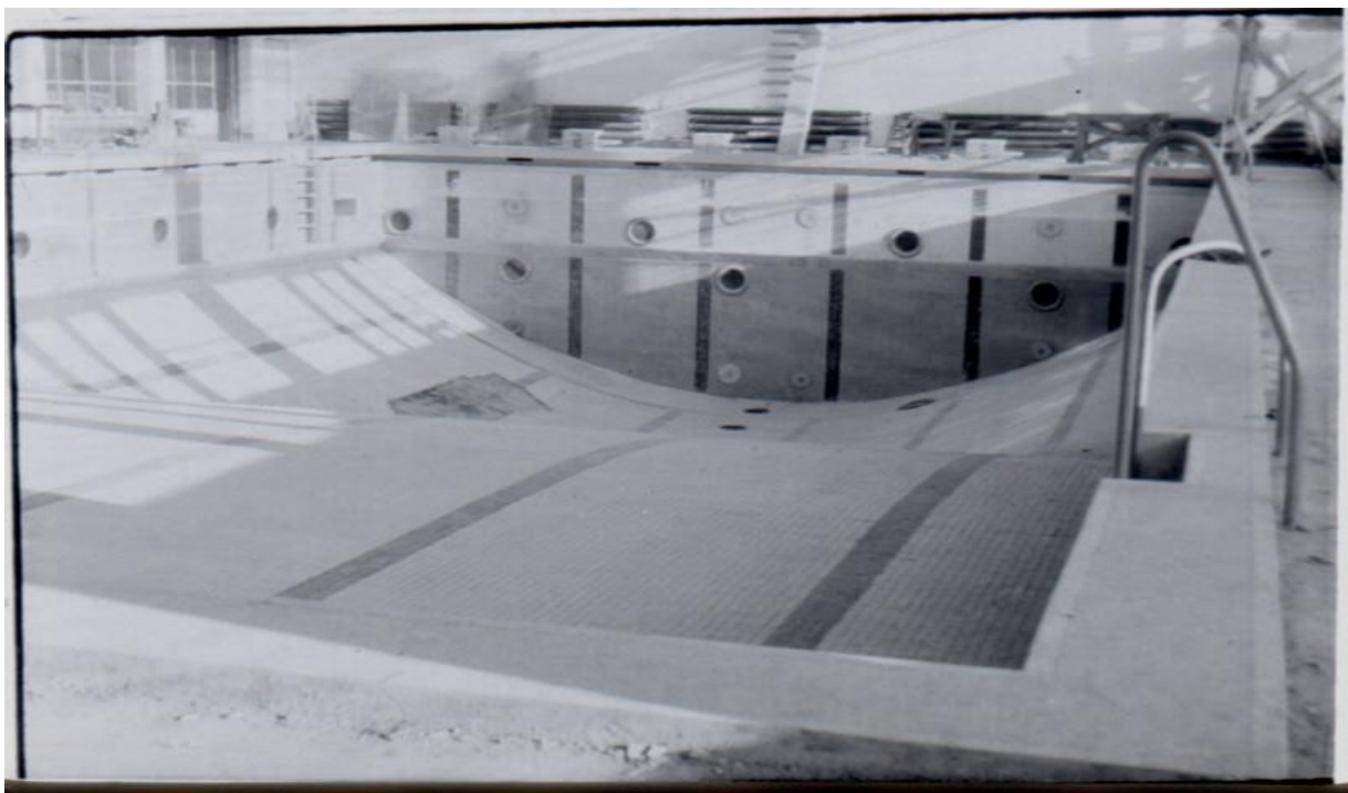
Rys. 5. MOSiR w Rzeszowie – niecka basenu

• W Hali widowiskowo – sportowej w Rzeszowie zastosowano fałdowy kształt konstrukcji przekrycia (rys. 6, rys. 7). Tutaj dominantą pierwszej wersji rozwiązania funkcjonalnego było umieszczenie pod jednym dachem trzech różnych funkcji sportowych: pływalnia, arena główna i boisko treningowe. Doprowadziło to do dwuprzegubowej fałdowej ramy stalowej, opartej na żelbetowych przyporach oraz do symetrycznego układu obustronnych trybun.