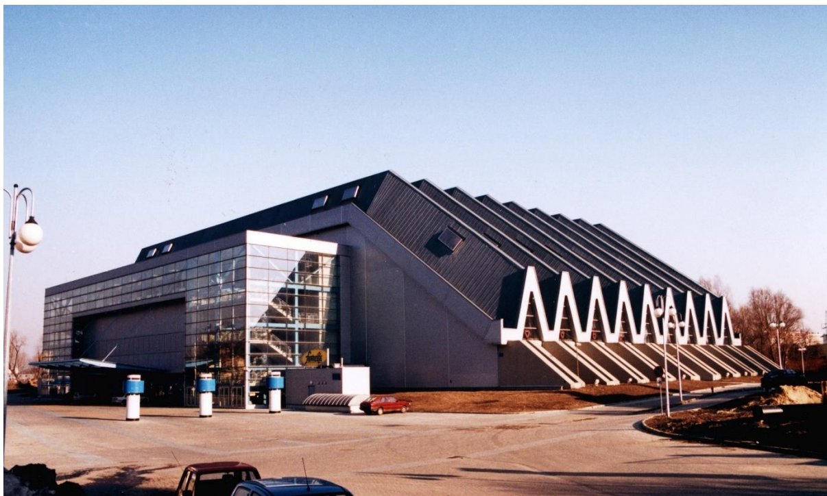
Rys. 7. Hala widowiskowo – sportowa w Rzeszowie po modernizacji

• Inne i o znacznie większej skali rozwiązanie zastosowano w obiektach sprężonych Aleppo Sport City w Syrii (ASC). Medina Rijadije Halabije to największy na terenie Małej Azji zespół obiektów sportowych – usytuowanych w półtoramilionowym Aleppo. Składa się z dużego stadionu dla 75000 widzów, hali sportowej dla 10000 widzów, krytej pływalni, kąpieliska otwartego i małego stadionu dla 15000 widzów. Prawie kilometrowej długości trzypiętrowa trybuna stadionu dla 75000 widzów wspiera się na monolitycznych ramach żelbetonowych, rozstawionych co około dziesięć metrów (rys. 8). Trybuny w całości są osłonięte dachem o trzydziestometrowym wsporniku (rys. 9). Każdą z belek wspornikowych sprężono 18 kablami CCL o nośności 1300 kN, złożonymi z 7 lin \Phi 13 mm. Duży stadion oddano do użytkowania jesienią 2004 roku, a pokazany na rysunkach 8 i 9 stan zaawansowania na nim robót budowlanych pochodzi z lipca 2004 r.