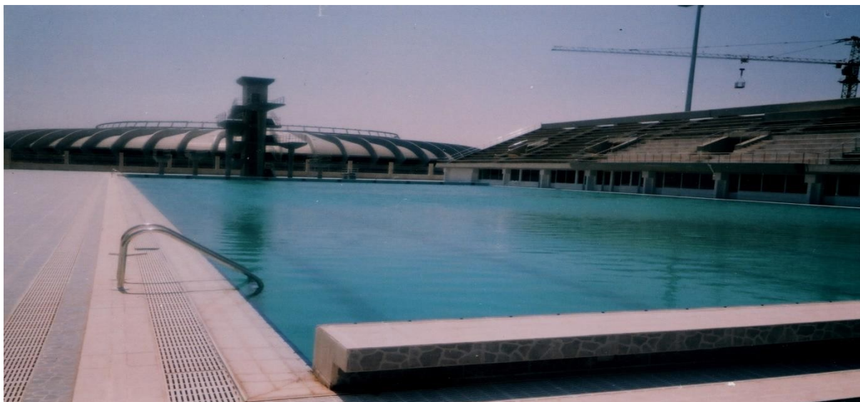
Rys. 11. ASC Aleppo – Syria kąpielisko otwarte; stan w 2004 r.

Nie mniej ważną od projektowej jest działalność Profesora jako eksperta budowlanego. Znalazła ona odbicie w kilkuset opiniach i ekspertyzach technicznych, pozwalających zapobiec awariom wynikającym z błędów powstałych w czasie projektowania lub wykonywania budowli. Ekspertyzach, dla których podbudowę stanowiła głęboka wiedza gromadzona także w czasie własnych lub nadzorowanych prac badawczych.