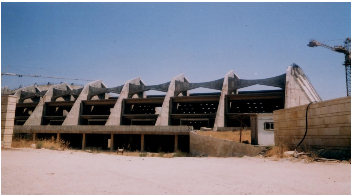
Rys. 10. Hala sportowa ASC Aleppo – Syria; stan zaawansowania robót w 2004 r.

Hala sportowo – widowiskowa dla 10000 widzów (rys. 10) i kryta pływalnia mieszcząca 3 baseny pływackie, obie wymiarach 100 x 100 m, są wprawdzie różne w kształcie, ale podobne z punktu widzenia konstrukcyjnego. Dachy utworzą pasma paraboloid hiperbolicznych, uzyskanych przez zawieszenie przekrycia z żelbetowych płyt prefabrykowanych na górnych pasach trójkątnych, stalowych dźwigarów kratowych. Po wypełnieniu przestrzeni międzyżebrowych w prefabrykatach, utworzą się monolityczne powłoki zapewniające dużą sztywność dachu. Widoczny na rysunku 10 stan zaawansowania prac budowlanych pochodzi z 2004 roku.