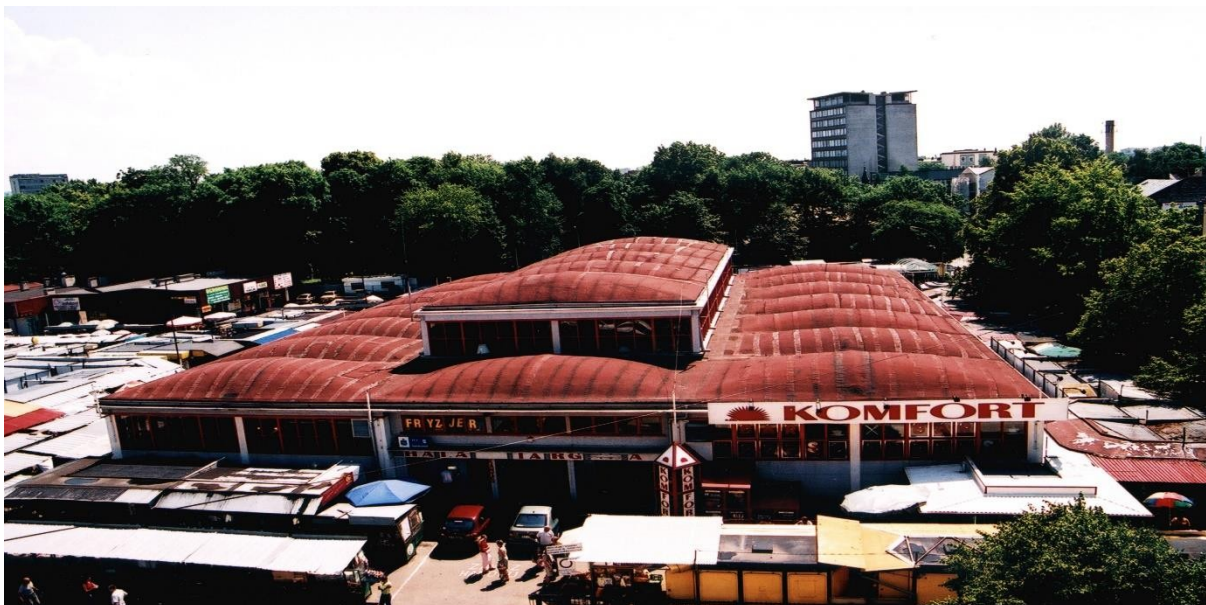
Rys. 1. Hala targowa w Rzeszowie 1)