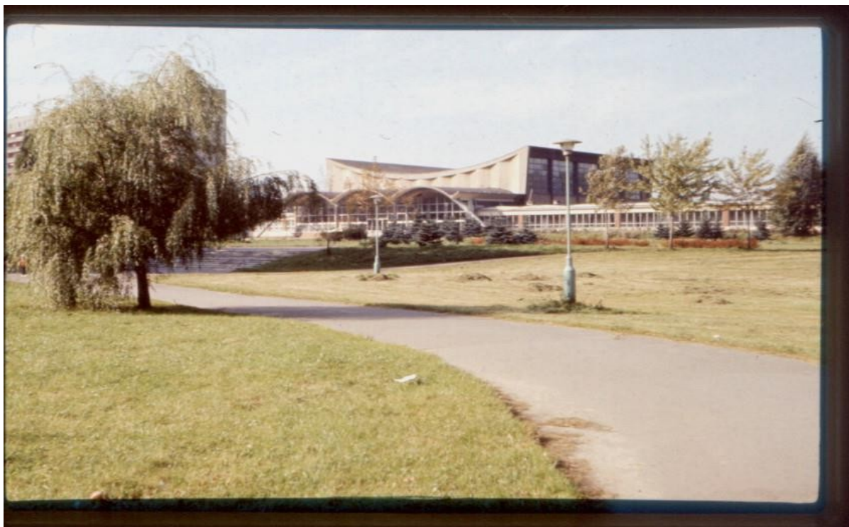
Rys. 3. MOSiR w Rzeszowie